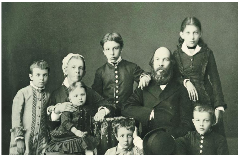
Семья Ульяновых. Слева направо стоят: Ольга, Александр, Анна; сидят – Мария Александровна с младшей дочерью Марией, Дмитрий, Илья Николаевич, Владимир. Симбирск. 1879 год.

Дзержинского, 12). Здесь происходили встречи и совещания членов красноярского марксистского кружка.