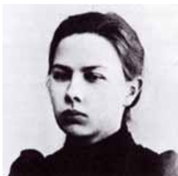
Надежда Крупская - жена Ленина

Вечером 8 мая Владимир Ильич прибыл на место поселения. Его