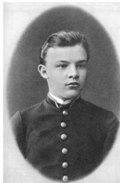
Владимир Ульянов – ученик гимназии

человека небольшого роста, довольно худощавого, с маленькой клинообразной бородкой, очень живого и подвижного, который все ссорится с железнодорожным начальством, указывая на ужасное переполнение поезда и требуя прицепки лишнего вагона».