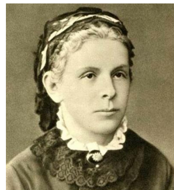
Мария Александровна Ульянова (Бланк) - мать Владимира Ульянова